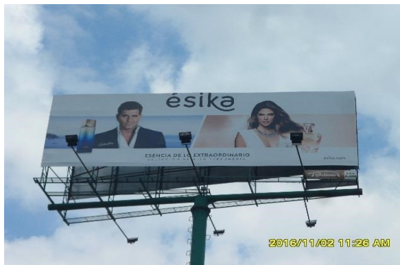
SENTIDO OESTE-ESTE - DE LA VALLA TUBULAR